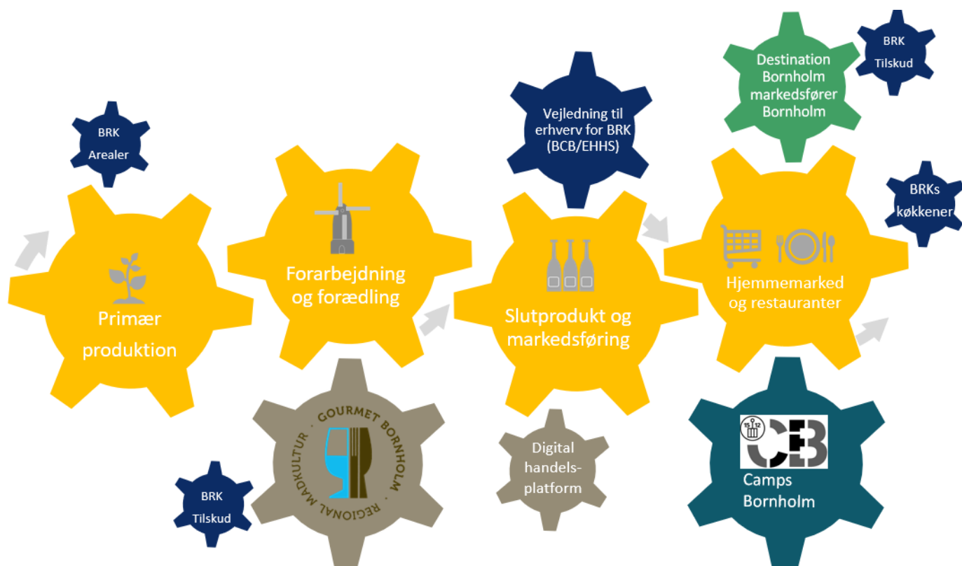
Figur 2 Strategiens drivkræfter

Værdikæderne starter hos landmændene i den primære produktion, hvor råvaren produceres. Her vil Bornholms Regionskommune undersøge, hvordan regionskommunens arealer bedst muligt kan understøtte lokale værdikæder.